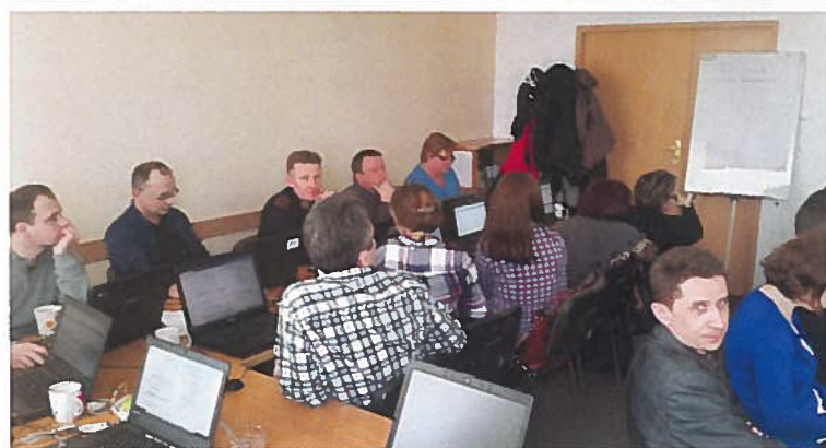
Szkolenie WIOŚ w Rzeszowie, dnia 19.03.2015 r.

Uczestnikom szkoleń zaprezentowano zmiany w systemie ISWK w podziale na: poszczególne obszary (zakładki) ISWK,