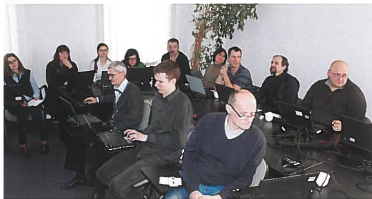
Szkolenie WIOŚ w Bydgoszczy, dnia 24.03.2015 r.