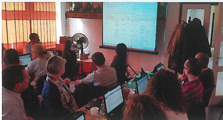
Szkolenie WIOŚ w Krakowie, dnia 20.03.2015 r.