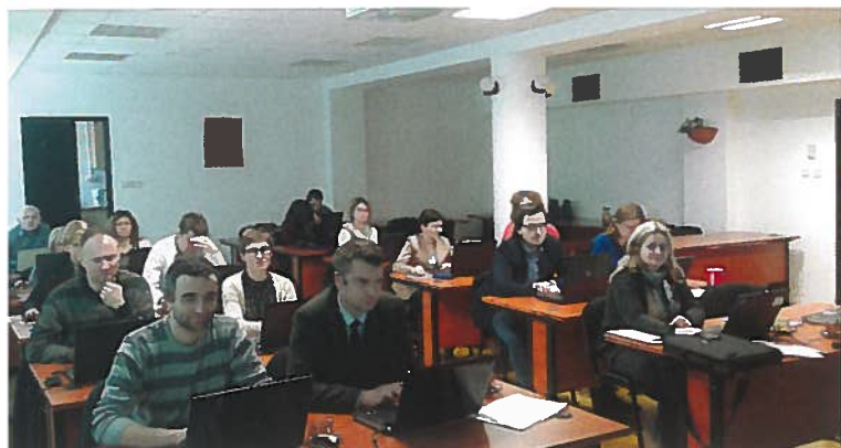
Szkolenie WIOŚ w Warszawie, dnia 18.03.2015 r.

Prowadzący szkolenia oraz przedstawiciele GIOŚ na bieżąco zbierali uwagi uczestników szkolenia związane z wdrożeniem nowej wersji ISWK oraz propozycje dalszych zmian w systemie. Zebrane uwagi i zaproponowane przez uczestników zmiany będą stanowiły podstawę do dalszych prac nad systemem. Przedstawiciele Wykonawcy wskazali również prace konieczne do wykonania przez użytkowników systemu, związane z wdrożeniem nowej wersji ISWK. Uczestnicy szkoleń otrzymali imienne certyfikaty poświadczające odbycie szkolenia.