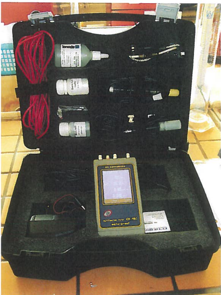
Multimetr Elmetron CX-461 wraz z elektrodami i wszystkimi akcesoriami niezbędnymi do pracy w terenie

W wyniku przeprowadzonego postępowania przetargowego w dniu 26 sierpnia 2015 r. zo-