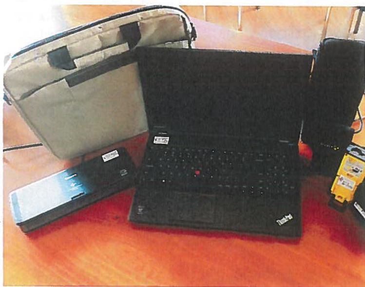
Zestaw sprzętu elektronicznego (komputer, skaner, aparat fotograficzny cyfrowy, odbiornik GPS)

W wyniku przeprowadzonego postępowania przetargowego w dniu 26 sierpnia 2015 r. zo-